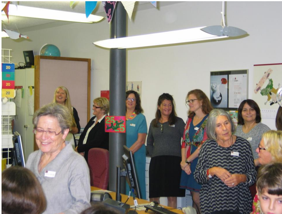
Das JUKIBU-Team freut sich über die Jubiläumsansprachen.