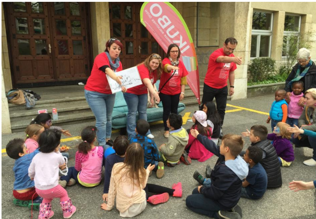
Cultibo-Fest: Eine Geschichte wird parallel in verschiedenen Sprachen erzählt