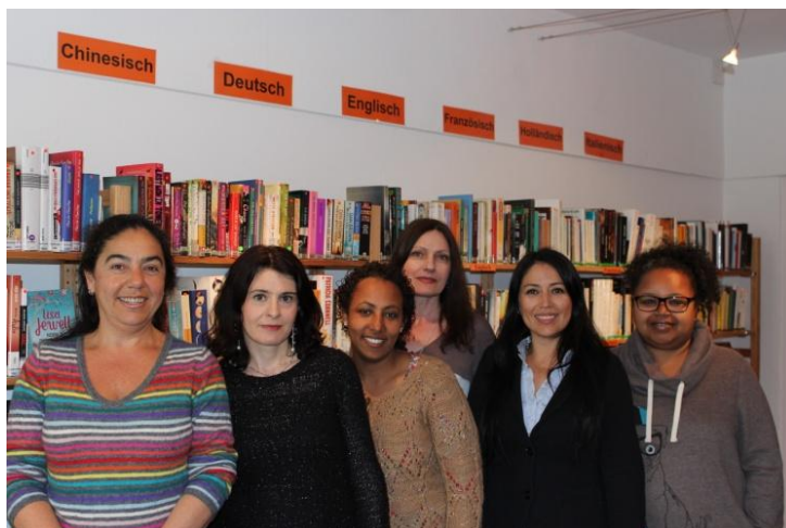
Das vossa lingua-Team