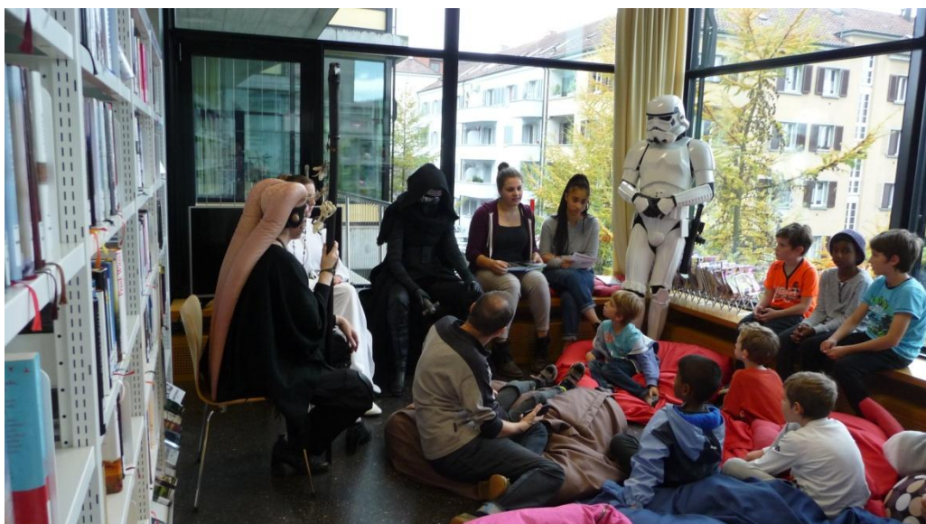
Star Wars-Tag in der PBZ Hardau