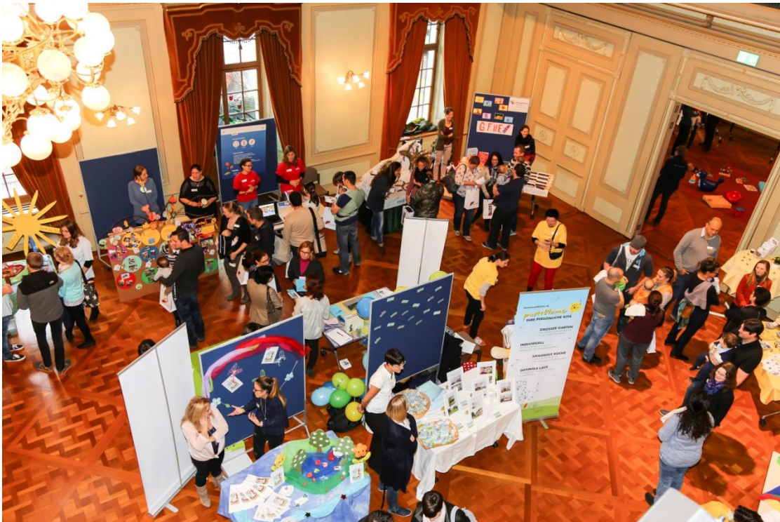
Die BdK am Frauenfelder Babyempfang 12.11.2016

Daneben sind Veranstaltungen im ähnlichen Umfang wie 2016 geplant. Neu im Angebot haben wir ab Februar 2017 das „Café Português“ und „Schenk mir eine Geschichte – Leseanimation für spanisch sprechende Kinder“. Am 2.9.17 werden wir uns wieder am grossen „Mitenandfest“ der Stadt Frauenfeld mit einer Bücher-/Lesecke beteiligen. Zudem planen wir eine Mitarbeit beim Frauenfelder Kulturtag vom 23.9.17.