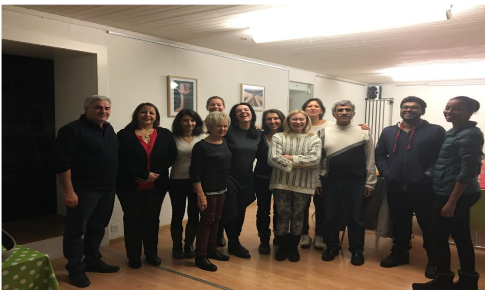
Das Bibliotheksteam beim Jahresabschluss-Essen