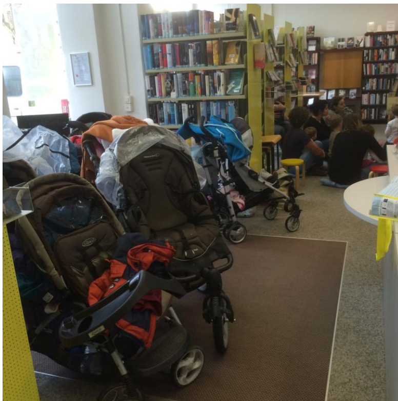
Storytime: Englisch / Deutsch für Eltern und Kinder von 0 bis 4 Jahre