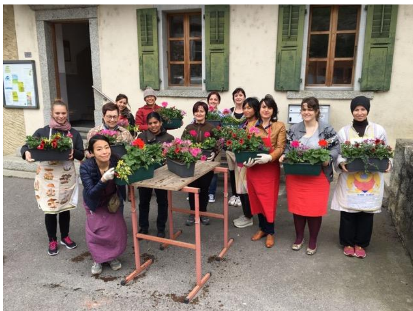
« On papote » autour d'une activité thématique

Enfin, il convient de relever encore une fois combien les bénévoles sont importants pour la survie de notre association. Que ce soit au comité ou dans le travail de bibliothèque, ils ne comptent pas leurs efforts pour atteindre les objectifs fixés. Merci à eux, du fond du coeur!