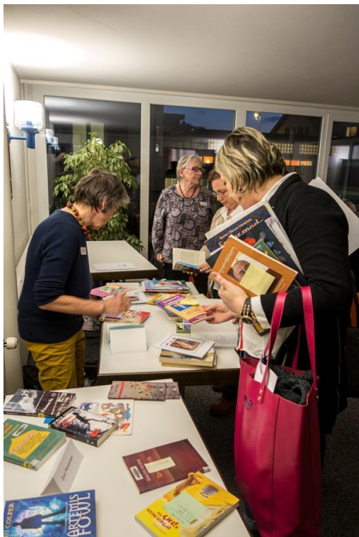
Marché aux livres

Photos de la journée de formation 2016 à Baar: