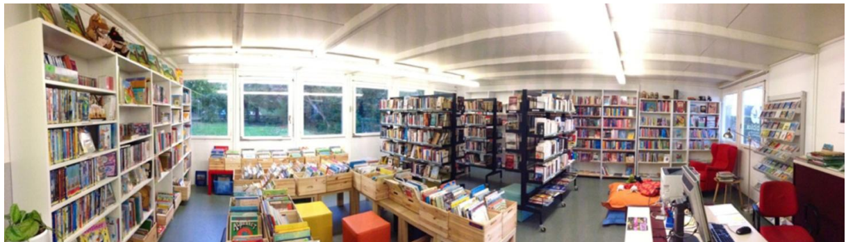
Innenansicht der interkulturellen Bibliothek biblios Thun

Neben Geschichten, welche die Kinderfantasien beflügeln, wird in vielen der Workshops aber auch spielerisch-pädagogisch gearbeitet. So können die Kinder etwa zusammen mit geschulten Fachpersonen erste Versuche in kindergerechtem Yoga oder orientalischem Schleiertanz machen. Dies fördert den Gleichgewichtssinn und die Wahrnehmung und stärkt so die Konzentrationsfähigkeit und das Selbstbewusstsein der Kinder und macht Spass. Die Angebote des ProjekteNetzwerks Thun sind kostenlos; das Mindestalter der Kinder variiert je nach Angebot. Die Teilnehmenden werden betreut; für die erwachsenen Begleitpersonen bleibt also Zeit für einen Kaffee, einen Schwatz oder einen Spaziergang. Das Projekt wird von contact-citoyenneté, dem gemeinsamen Förderprogramm des Migros-Kulturprozent und der Eidgenössischen Migrationskommission EKM, unterstützt.