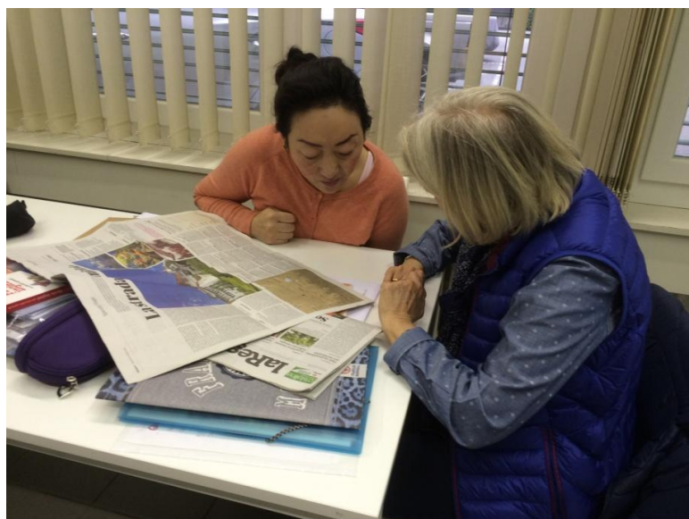
Corso per i richiedenti l'asilo

Ricciogirarondo intende di collaborare più con le scuole per promuovere la discussione della significazione della lingua prima dagli insegnanti e per organizzare dei libri nelle diverse lingue e bilinguili per le biblioteche scolastiche. Questo progetto sarà effettuato insieme a Interbiblio.