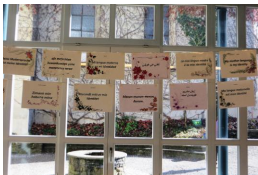
Tag der Muttersprache

Gerne möchten wir auch wieder zu Lesungen einladen. Diese sind jedoch erst in Planung.