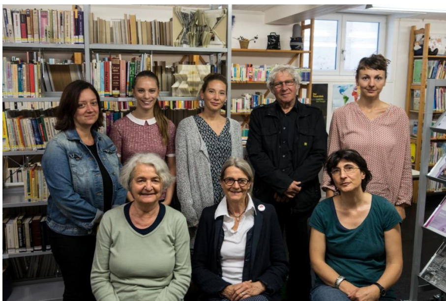
Vorstand / Comité 2016