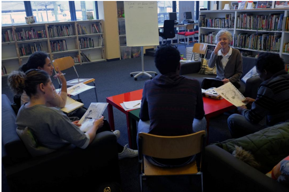
« Le nez » : Atelier de conversation pour apprendre les premiers mots de français

En 2017, nous maintiendrons l'offre riche et variée d'activités proposées en 2016. Parallèlement à nos prestations, nous poursuivrons la réorganisation de l'association, fêterons notre 15ème anniversaire et lancerons une nouvelle identité visuelle et un nouveau site Internet.